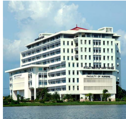
ภาพที่ 1 : อาคารและที่ตั้งของคณะพยาบาลศาสตร์ มหาวิทยาลัยศรีนครินทรวิโรฒ